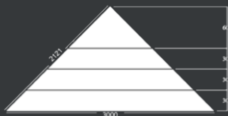
Ritningen visar hörntrappa med fyra trappsteg sett uppifrån. Trappans höjd: 1200 mm.