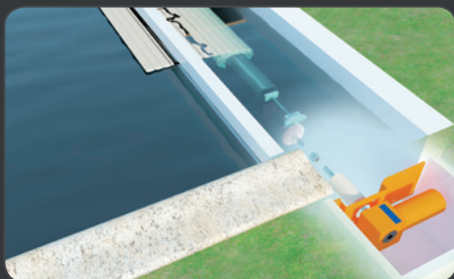
Walu Roll Exteo med motoren i en tør kasse.

Priseksempel: inkl. hvide, grå eller sandfarvede lameller med vinger samt bjælke og fastgørelser til akslen og bjælke under kanten. Vejl. cirkapriser (inkl. moms) 1